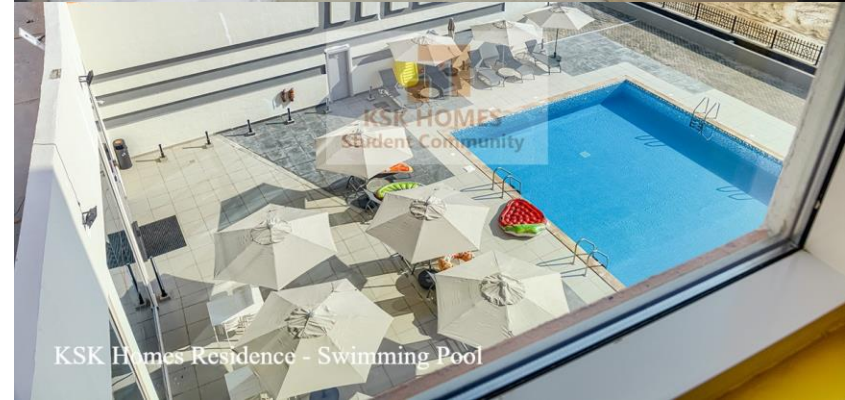
KSK Homes Residence - Swimming Pool