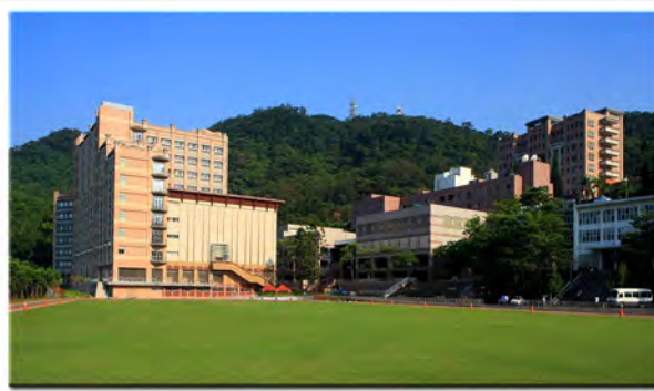
外双溪キャンパス